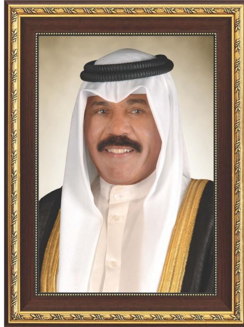
حضرة صاحب السمو الشيخ نواف الأحمد الجابر الصباح أمير دولة الكويت

H.H. Sheikh Nawaf AL-Ahmad Al-Jaber Al-Sabah The Amir Of The State Of Kuwait