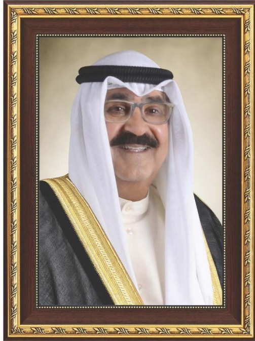
سمو الشيخ مشعل الأحمد الجابر الصباح ولي عهد دولة الكويت

H.H. Sheikh Meshal AL-Ahmad Al-Jaber Al-Sabah The Crown Prince Of The State Of Kuwait